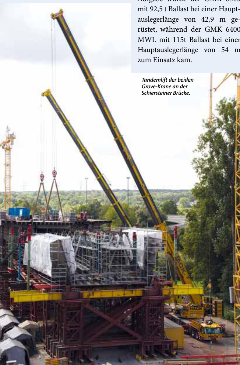
Tandemlift der beiden Grove-Krane an der Schiersteiner Brücke.

Von Mainz aus ging es für den GMK 6300 dann zu einem Wochenendeinsatz, während der GMK 6400 sich auf den Weg zu einem Windpark in Hessen machte. KM