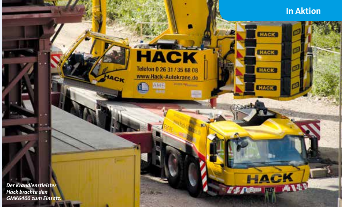
Der Krandienstleister Hack brachte den GMK6400 zum Einsatz.

Im Tandemhub sollten die beiden Krane acht Einheiten der neuen Brücke in zwei Tagen einsetzen, wobei der 300-Tonner einmal umgesetzt werden musste. Die Besonderheit der Hube bestand darin, dass beide Kranbediener ab Störkante Brücke